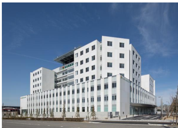
名古屋徳洲会総合病院