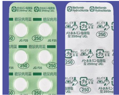
メトホルミン塩酸塩錠 250mg「JP」