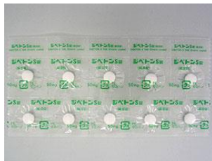
ジベトンS 腸溶錠 50mg